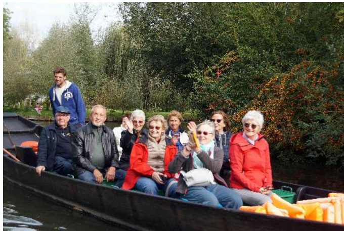
Amiens-Hortillonnages – En barque

Il fallut s'arracher à cette séduisante localité pour remonter vers la Picardie et en particulier vers sa capitale Amiens. Après un excellent repas servi dans un restaurant du réputé quartier de Saint-Leu, au pied de la plus grande cathédrale gothique de France, l'après-midi débuta par une balade bucolique en barques dans les hortillonnages... ces multiples bras de la Somme qui, aux siècles passés accueillirent les maraichers et maintenant des personnes avides de dépaysement, de détente... sans oublier de nombreux touristes.