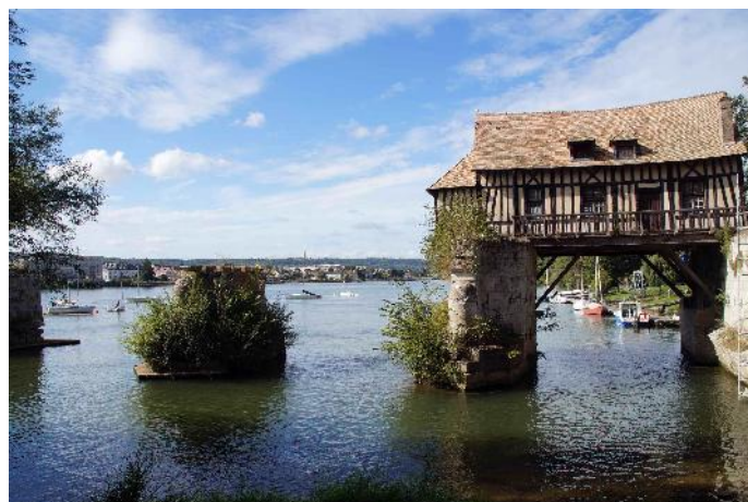
Le Moulin de Vernonnet sur les piles du pont du XII e s.

Le retour vers l'hôtel donna l'occasion de visiter, en bordure de Seine, la belle ville de Vernon et d'admirer l'étonnant moulin de Vernonnet planté, au-dessus du fleuve, sur deux des piles de l'ancien pont du 12 e siècle. Sur la rive gauche, de nombreuses maisons à colombages ont miraculeusement échappé aux affres des guerres et offrent un cachet tout particulier à cette ville fondée au 9 e siècle par Rollon, premier duc de Normandie. Vernon brula, en effet, pendant dix jours, en 1940, après avoir été arrosée par les bombes allemandes... avant de revivre ce cauchemar, quatre ans plus tard, sous le feu des Alliés.