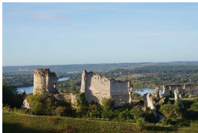
Les Andelys : Château-Gaillard