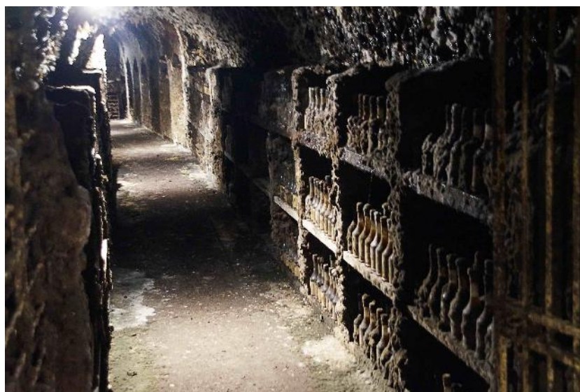
Calvados Morin – Dans la galerie, l'humidité ambiante et les vapeurs d'alcool sont propices au développement de « moisissures nobles » sur les bouteilles qui sont vendues ainsi couvertes à des amateurs essentiellement orientaux !