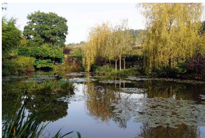
Giverny – Jardins de Claude Monet

Beaucoup en avaient rêvé et ils ne furent pas déçus : la visite de la maison et des jardins de Claude MONET se révéla un réel enchantement : foisonnement un peu désordonné de fleurs, de couleurs, magnifiques reflets dans les plans d'eau, calme et sérénité (à cause du covid, les étrangers extraeuropéens n'étaient pas nombreux) et toute une matinée pour flâner dans ce haut-lieu de l'impressionnisme. La maison se présentait comme un livre ouvert sur la vie du maître qui repose avec sa famille à côté de l'église paroissiale. Giverny, un charmant village dont le cœur bat au rythme du grand peintre !